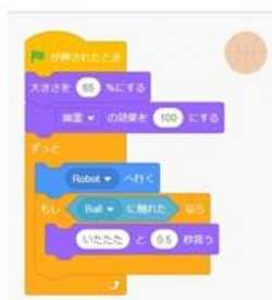
▲スクラッチプログラミング

講座の内容 人工知能（AI）について講義と作成を通してAIについての理解を深める。また、デジタル技術によるモノづくりとして、パソコンのブラウザを利用したスクラッチプログラミングにAIを実装することで簡単なゲームを作ります。